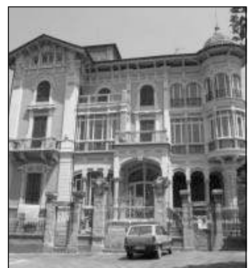
A. P. Villa Rosa ospita il Museo del vetro

Il Comune nei mesi scorsi aveva utilizzato in via sperimentale un vecchio fornello. Troppo rumoroso e inquinante: i vicini di casa sono insorti. «Adesso bisogna correre ai ripari, impossibile concepire il museo senza la fornace», hanno detto in Comune. Un'ipotesi di soluzione è venuta dopo la recente partecipazione del Museo del vetro e dei maestri soffiatori altaresi al Festival della Scienza, dove la delegazione valbormidese nel proprio stand ha utilizzato un piccolo forno concesso in uso gratuito dalla ditta Falorni Forni di Empoli. Un sogno da trenta mila euro circa.