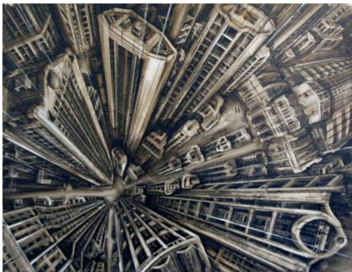
Fabio Gianpietro - Vertigo - 2007 - olio su tela - cm 100x120

L'artista però compie un passo in più, come si evince dall'installazione: materializza una figura che prende vita dal compenetrarsi di tutte le muse ritratte. Diviene tattile ed esistente. Sul supporto è proiettata la metamorfosi del corpo che muta con l'evolversi del tempo. La sagoma di luce diviene reale e al contempo si sdoppia in una simmetria speculare.