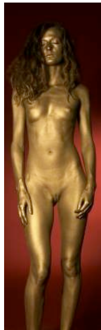
Alessio Delfino - Gea - 2006 - stampa lambda su perspex e dibond - cm 50x167 - ed. 1 di 5

Alessio Delfino conosce le sue muse e, attraverso un'indagine scrupolosa, trova nelle loro radici la chiave per interpretarle. A ognuna di esse destina il nome di una dea che rispecchia le peculiarità caratteriali di colei che ritrae. Una ricerca che si spinge nei meandri della psiche. La studiosa americana Jean Shinoda Bolen aveva evidenziato in Le Dee dentro le donne che alcuni elementi caratteriali femminili potevano essere ricondotti agli archetipi delle divinità greche. Gli stessi proposti si