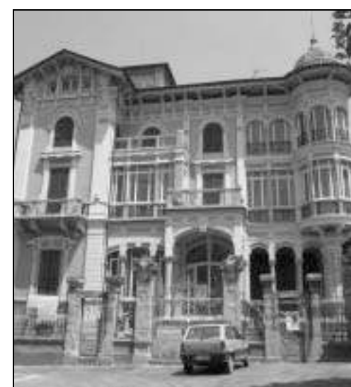
A. P. Villa Rosa ospita il Museo del vetro

Il Comune nei mesi scorsi aveva utilizzato in via sperimentale un vecchio fornello. Troppo rumoroso e inquinante: i vicini di casa sono insorti. «Adesso bisogna correre ai ripari, impossibile concepire il museo senza la fornace», hanno detto in Comune. Un'ipotesi di soluzione è venuta dopo la recente partecipazione del Museo del vetro e dei maestri soffiatori altaresi al Festival della Scienza, dove la delegazione valbormidese nel proprio stand ha utilizzato un piccolo forno concesso in uso gratuito dalla ditta Falorni Forni di Empoli. Un sogno da trenta mila euro circa.