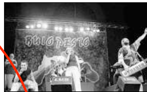
Buio Pesto, concerto con polemiche a Stella