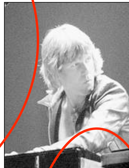
Il grande Keith Emerson in versione "cafon-rock" al Priamar di Savona

L'estate 2006 sta per andare in archivio. Tra qualche settimana arriveranno i dati sulle presenze turistiche che ci racconteranno, probabilmente, di una Riviera ancora in crisi con qualche segnale di ripresa. Ma un bilancio, per quanto riguarda le manifestazioni, si può fare. E il quadro che emerge è quello di una provincia, quella di Savona, che alterna a grandi momenti di cultura e di spettacolo significativi, alcune cadute nel "trash" più autentico.