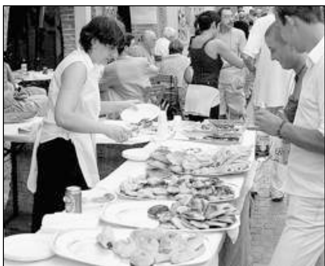
A Mallare si ripete il rito di fine estate, tra prodotti tipici e libri

Mallare. Libri e fassini, cultura e gastronomia popolare. Il binomio funziona alla grande da molti anni, a Mallare.